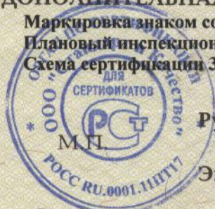
Схема сертификации З.

Планный инспекционный контроль: ноябрь 2008 г., ноябрь 2009 г.