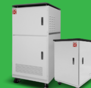
氫能燃料電池 產氫機