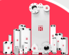
硬銲型板式熱交換器