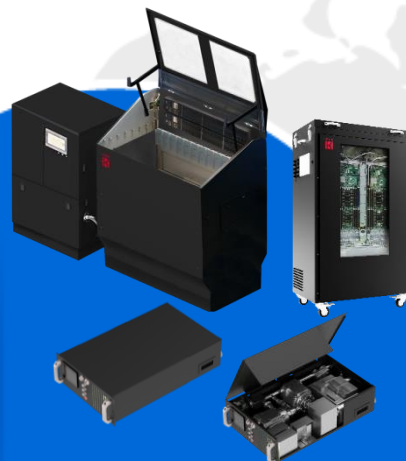
大型資料中心 浸沒式槽體及 冷卻單元