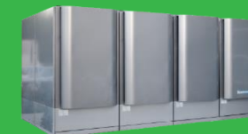
固態氧化物燃料電池 SOFC 關鍵零組件